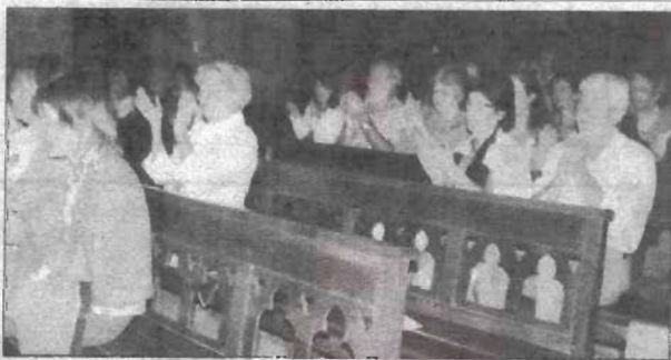
Un public conquis par la prestation des artistes.

Du 7 au 9 septembre, les Marcillacois ont pu se délecter de quatre concerts exceptionnels, en l'église St-Martial. L'association A Tempo avait, il faut dire, prévu une programmation de premier choix. C'est la première soirée qui a attiré le plus de monde. Le pianiste Frédéric Vaysse-Knitter a conquis son public interprétant avec brio Haydn, Beethoven, Debussy, Satie, Chopin. Une déception par contre pour l'après-midi enfantine avec Pierre et le loup qui n'a pas attiré le public escompté. Pour le dernier récital, l'église s'est à nouveau bien remplie pour écouter les